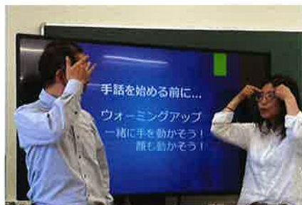
講師ペアによる楽しいコント！