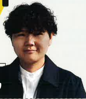
映画監督 今井 ミカ