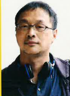
映画監督 深田 晃司