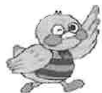
さいたまっちゃん