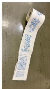
①手話トイレトーパー ②クリアファイル