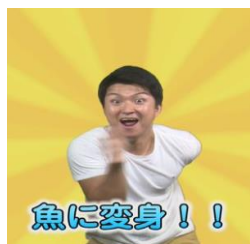
「もっともっとみずもっと」