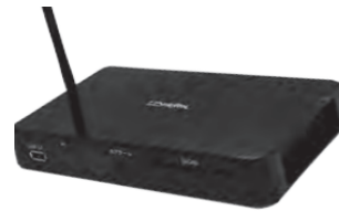
聴覚障害者用情報受信装置 「アイ・ドラゴン4」

認定特定非営利活動法人 障害者放送通信機構は、文化庁からリアルタイム字幕配信事業者の指定を受けています。