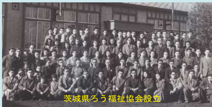
茨城県ろう福祉協会設立