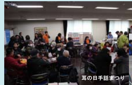
耳の日本語まつり