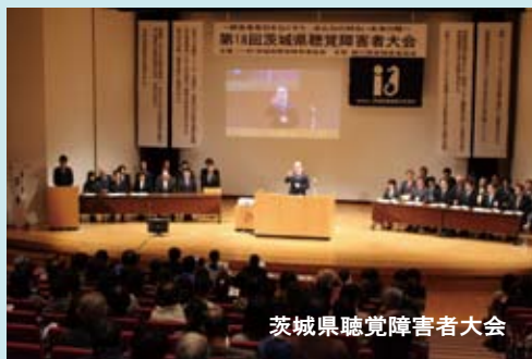
茨城県聴覚障害者大会