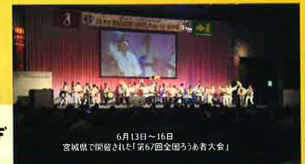
6月13日~16日 宮城県で開催された「第67回全国ろうあ者大会」