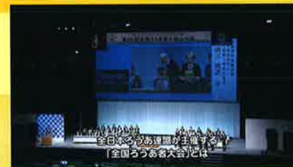
第67回全国ろうあ者大会 in みやぎ

「カシマス・ド・スル大会ダイジェスト」と 「過去のろうあ者大会(大阪大会&宮城大会)を お届けします!