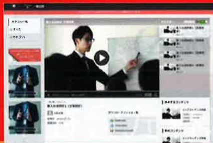
動画視聴サイト(イメージ)