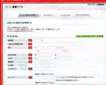
参加登録WEBサイト(イメージ)